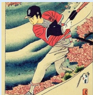
描画AIに描かせた大谷翔平